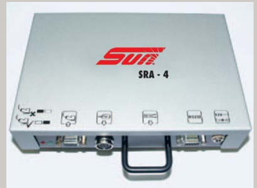
SUN SRA 4 Drehzahladapter