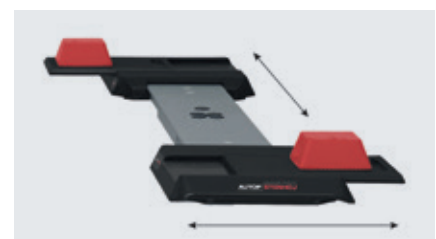
XY-Schieber mit Gummiauflagen