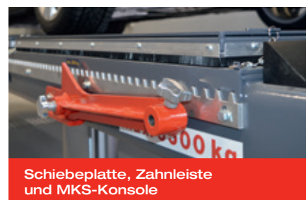
Schiebeplatte, Zahnleiste und MKS-Konsole