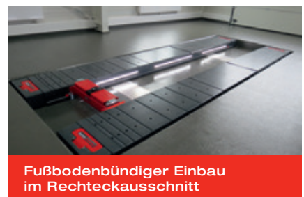
Fußbodenbündiger Einbau im Rechteckausschnitt