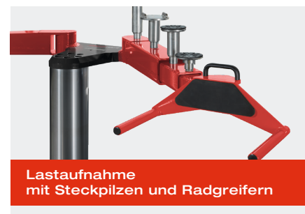
Lastaufnahme mit Steckpilzen und Radgreifern