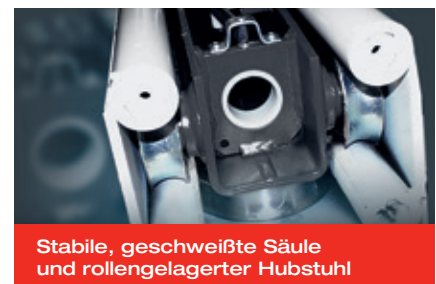
Stabile, geschweißte Säule und rollengelagerter Hubstuhl