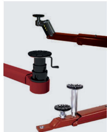
CF-Aufnahme / CF-08 Aufnahme / F-Aufnahme