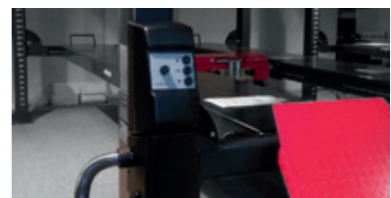
Steuerung und Aggregat an der Säule hinten links