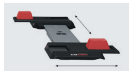
XY-Schieber mit Gummiauflagen