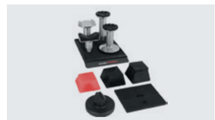
Diverse Auflagen und Steckpilze