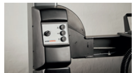
Aggregat und Steuerung an Säule vorne links