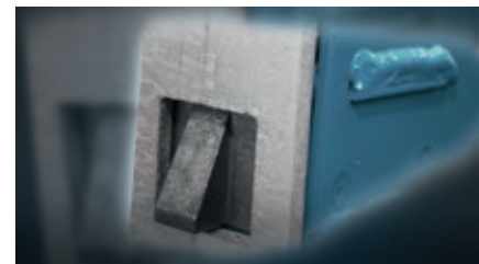
Klinke für Parkposition