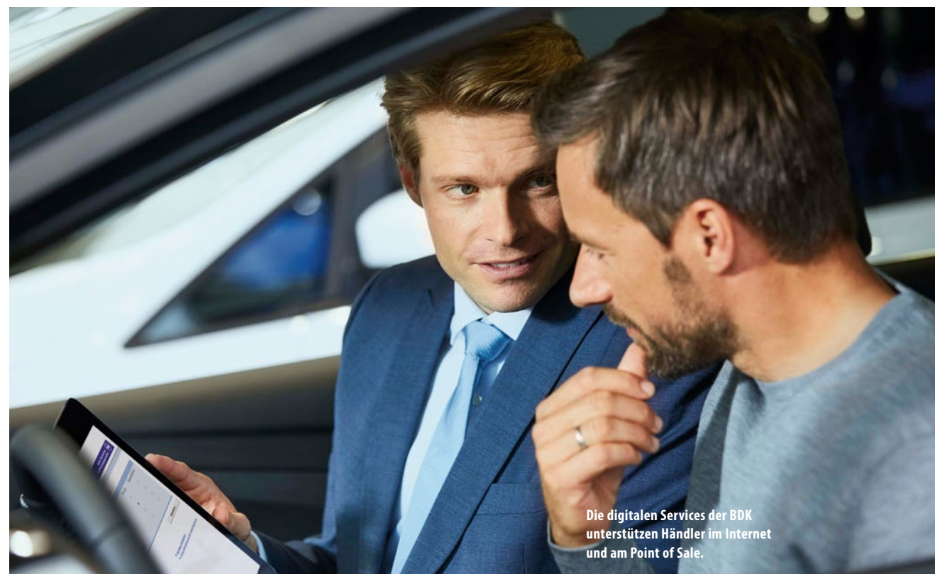
Die digitalen Services der BDK unterstützen Händler im Internet und am Point of Sale.