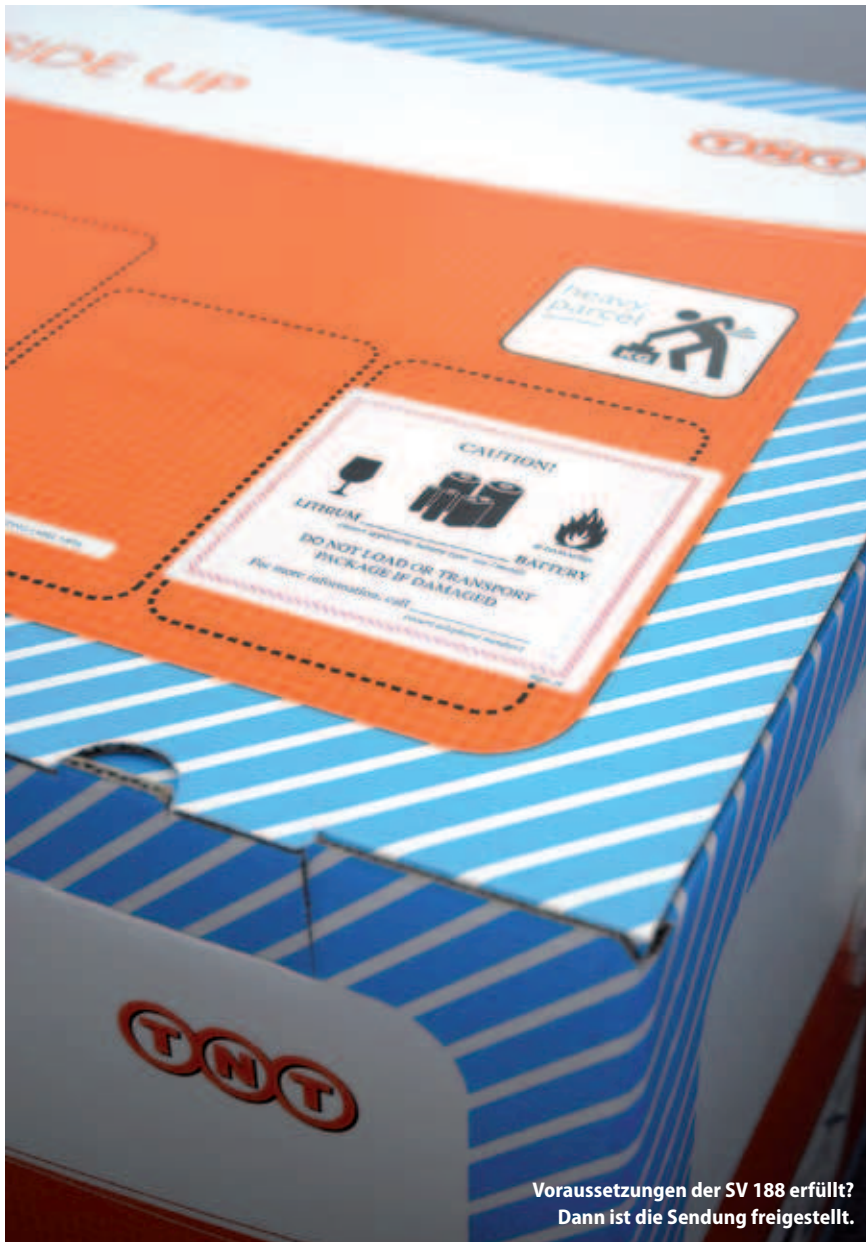
Voraussetzungen der SV 188 erfüllt? Dann ist die Sendung freigestellt.