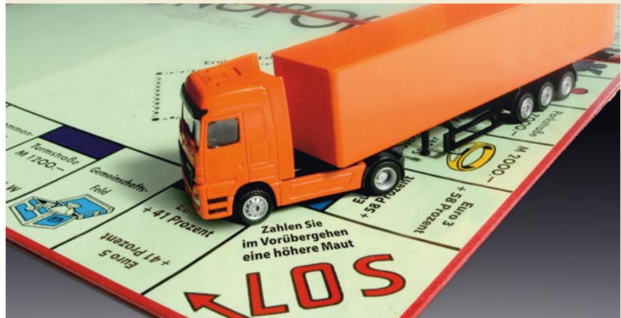
Sebastian Bollig/Montage: Alexander Wallnöfer