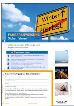
Sicher fahren Bestell-Nr.: 13982