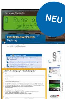
Nachtrag Bestell-Nr.: 13931