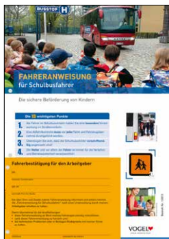
Schulbusfahrer Bestell-Nr.: 13973