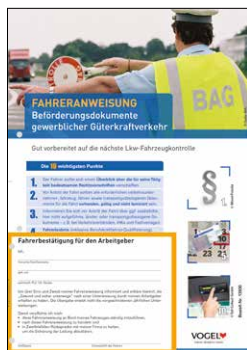
Beförderungsdokumente gewerblicher Güterkraftverkehr Bestell-Nr.: 13930