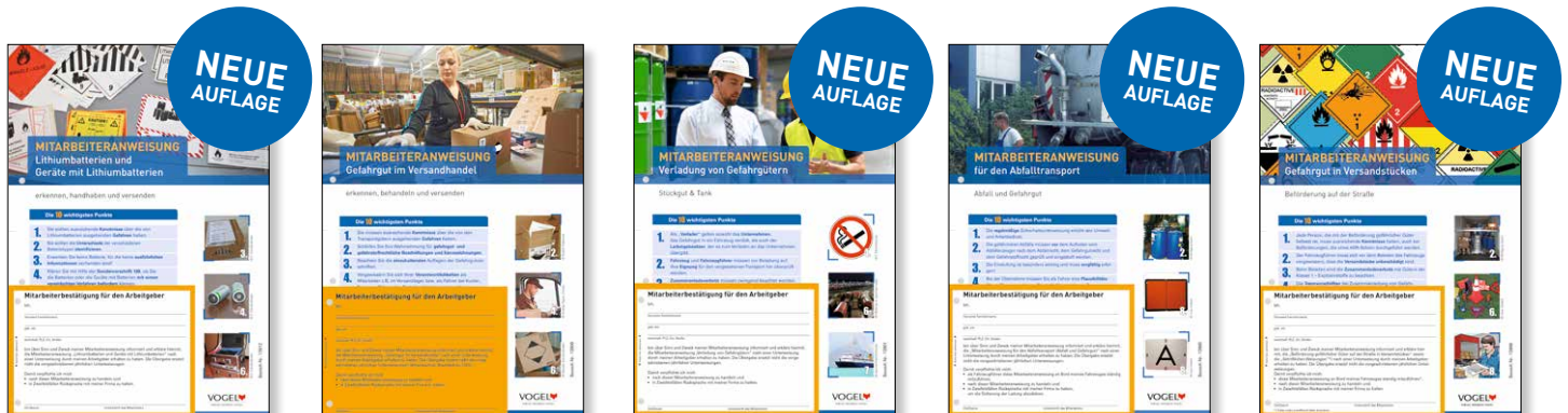
Lithiumbatterien Bestell-Nr.: 13912