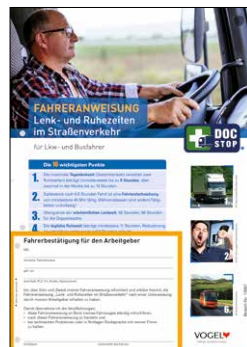
Lenk- und Ruhezeiten Bestell-Nr.: 13981