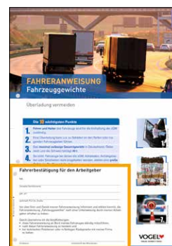
Fahrzeuggewichte – Überladung vermeiden Bestell-Nr.: 13968