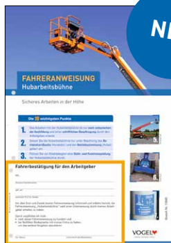
Hubarbeitsbühne Bestell-Nr.: 13945