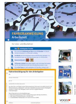
Arbeitszeit für Lkw- und Busfahrer Bestell-Nr.: 13964