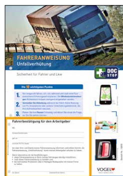
Unfallverhütung Bestell-Nr.: 13978