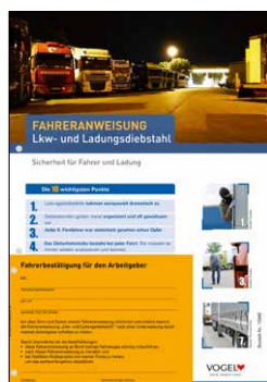
Lkw- und Ladungsdiebstahl Bestell-Nr.: 13942