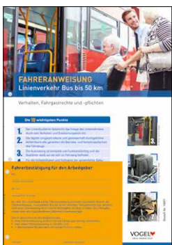
Linienverkehr Bus bis 50 km Verhalten, Fahrgastrechte und -pflichten Bestell-Nr.: 14651