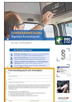
Digitales Fahrtenschreiber Bestell-Nr.: 13972