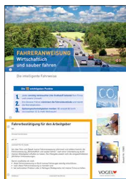
Wirtschaftlich und sauber fahren Bestell-Nr.: 13983