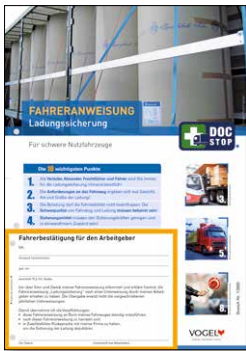
Ladungssicherung für schwere Nutzfahrzeuge Bestell-Nr.: 13980