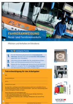
Reise- und Fernlinienverkehr Bestell-Nr.: 13910