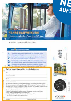
Linienverkehr Bus bis 50 km Arbeits-, Lenk- und Ruhezeiten Bestell-Nr.: 14650