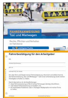
Taxi und Mietwagen Bestell-Nr.: 13977