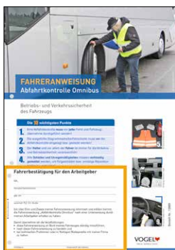
Abfahrtskontrolle Omnibus Bestell-Nr.: 13989