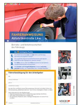
Abfahrtkontrolle Lkw Bestell-Nr.: 13988