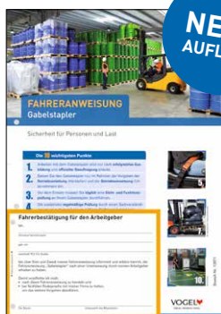
Gabelstapler Bestell-Nr.: 13971