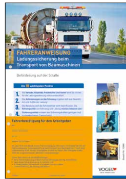
Ladungssicherung beim Transport von Baumaschinen Bestell-Nr.: 13966

Günstige Staffelpreise bei allen Fahreranweisungen