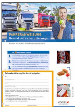
Gesund und sicher unterwegs Bestell-Nr.: 13965