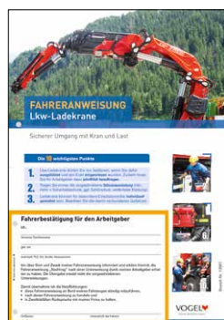
Lkw-Ladekrane Bestell-Nr.: 13967