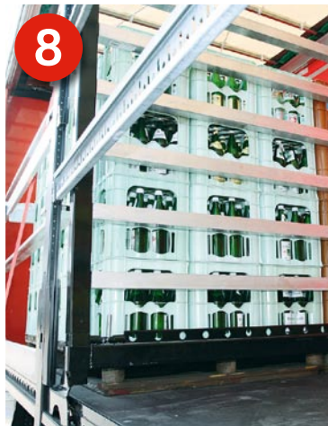
8 Weitere Lasi-Variante: Kipplatten sowie Sperrbalken, die mittels Lochschiene mit dem Fahrzeugaufbau verbunden sind.