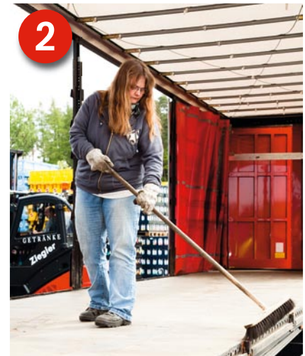
2 Voraussetzung: Sie müssen über ein geeignetes Fahrzeug (DIN EN 12642 Code XL für Getränke) verfügen und die Ladefläche besenrein säubern.