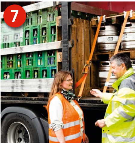
7 Geschafft: Die Ladung ist richtig geladen und gesichert, so dass die Plane geschlossen werden kann und das Fahrzeug abfahrbereit ist.