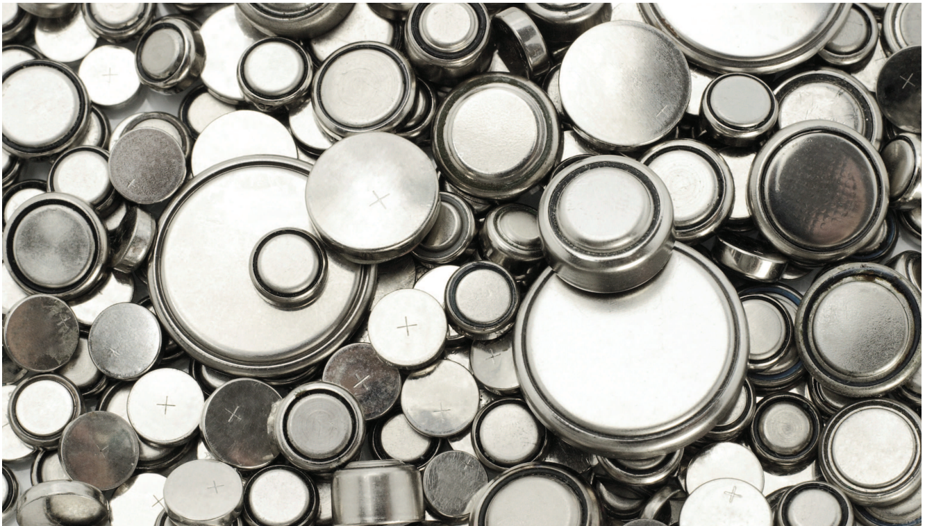
Knopfzelle ist nicht mehr gleich Knopfzelle: für Knopfzellen mit mehr als 0,3 Gramm Lithium gelten gegebenenfalls andere Versandbedingungen.

VERSANDABWICKLUNG Beim Transport von Lithiumbatterien per Luftfracht sind seit Jahresbeginn einige wichtige Neuerungen zu beachten.