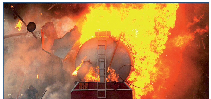
LAGER / WAREHOUSE

Please find herein a comprehensive overview under the form of a table of contact persons in admission offices in Germany and abroad.