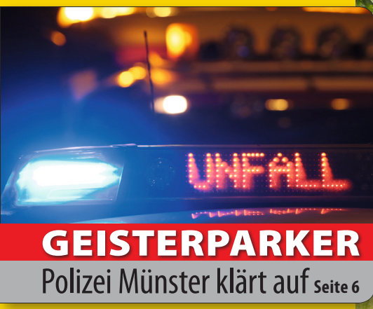
GEISTERPARKER Polizei Münster klärt auf Seite 6