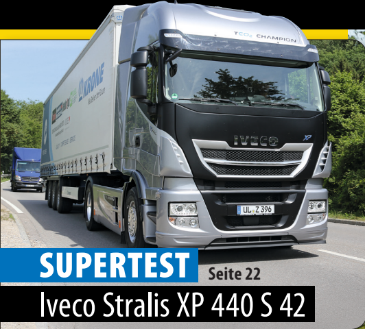
SUPERTEST Seite 22 Iveco Stralis XP 440 S 42