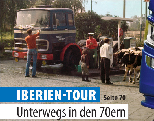
IBERIEN-TOUR Seite 70 Unterwegs in den 70ern