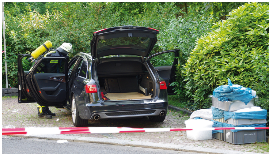
Trockeneisladung mit Todesfolge. Die Klimaanlage hatte wohl das sublimierte CO 2 nur umgewälzt.

Im ADR 2015 war unter anderem folgender neue Absatz 5.5.3.1.5 vorgesehen, vorab bereits von vielen Staaten in Form der multilateralen Vereinbarung M260 umgesetzt: Die Unterabschnitte 5.5.3.6 und 5.5.3.7 finden nur dann Anwendung, wenn eine tatsächliche Erstickungsgefahr im Fahrzeug oder Container besteht. Den betroffenen Beteiligten obliegt es, dieses Risiko unter Berücksichtigung der von den für die Kühlung oder Konditionierung verwendeten Stoffen ausgehenden Gefahren, der Menge der zu befördernden Stoffe, der Dauer der Beförderung und der zu verwendenden Umschließungsarten zu beurteilen. In der Regel ist davon auszugehen, dass von Versandstücken, die Trockeneis (UN 1845) als Kühlmittel enthalten, kein diesbezügliches Risiko ausgeht. Der letzte Satz wurde bei der letzten WP.15-Sitzung der UN im Mai 2014 wieder gestrichen, da es zwischenzeitlich zu