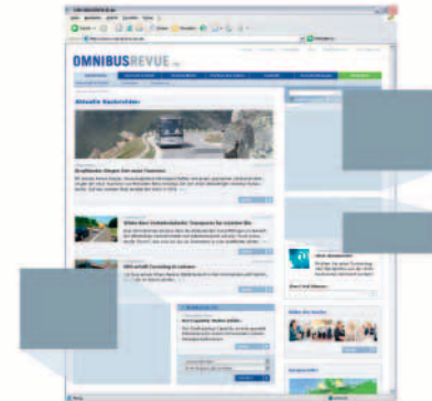
» Entwicklung der P1's

6 Werbeformen und Preise: Visits: 7.700/Stand Juli 2007 Pageimpressions: 28.726/Stand Juli 2007