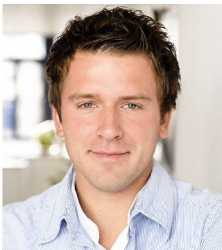
© Titel: Andreas Heise (l.), Daimler (M.), Stark Reinigungsgeräte (r.)

Doch am Ende kann sich nicht nur ein umsichtiger Kauf lohnen, auch regelmäßige Pflege und lückenlose Wartung zahlen sich später aus. Das ist auch immer wieder bei den Gebrauchtbushändlern zu hören, die stets Wert auf „gepflegte“ Fahrzeuge legen. Für den Busunternehmer kann es sich beim Neukauf lohnen, einen Service- und Wartungsvertrag beim jeweiligen Hersteller abzuschließen (siehe OMNIBUSREVUE