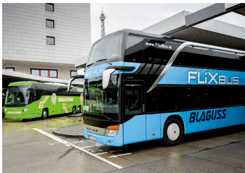
Die Gebrauchtbusbranche erwartet die Fernbus-Rückläufer mit Spannung