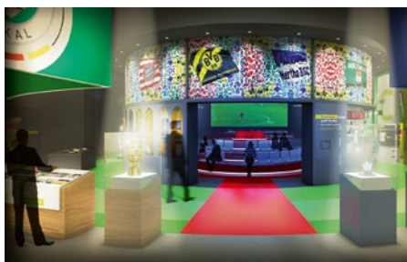
Am 25. Oktober 2015 eröffnet das Deutsche Fußballmuseum des DFB in Dortmund

tisiert. Mit den Worten „Deutschland ist zurück im Fußball-Himmel!“ feierte Kommentator Tom Bartels den Sieg zum vierten WM-Titel 2014. Und wenn es in Deutschland einen Fußball-Himmel gibt, dann ist der im neuen Deutschen Fußballmuseum des DFB. Momente, die in Deutschland Geschichte schrieben, werden auf 7.700 Quadratmetern erzählt und mit modernsten Ausstellungs-