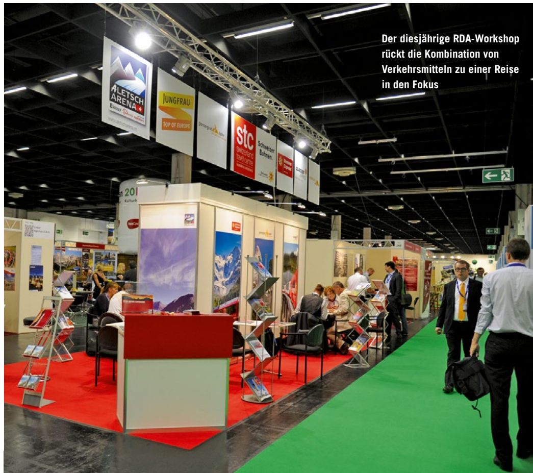
Der diesjährige RDA-Workshop rückt die Kombination von Verkehrsmitteln zu einer Reise in den Fokus