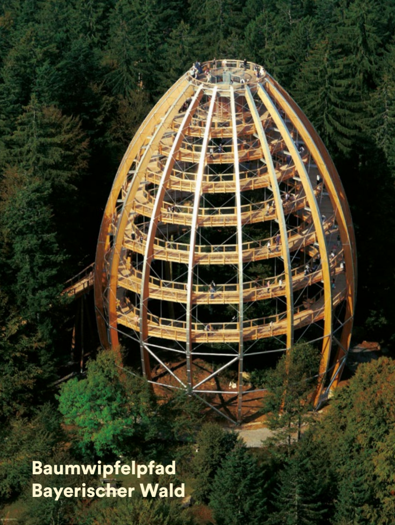
Baumwipfelpfad Bayerischer Wald