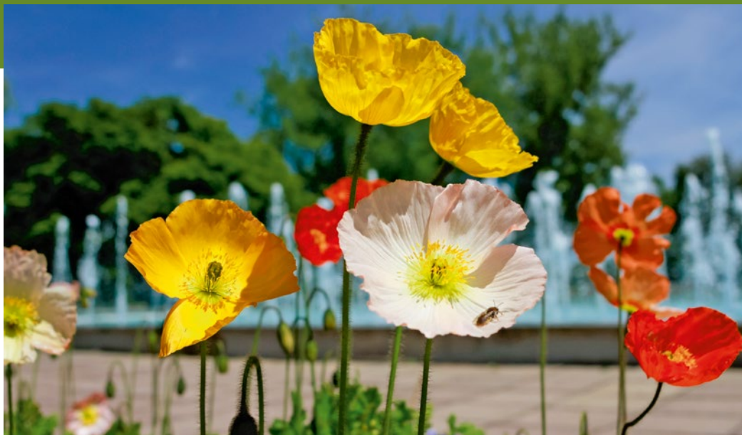
„GartenReich“ lautet das Jahresthema 2016 im egapark Erfurt

Open-Air-Veranstaltungen und florale Hallenschauen komplettieren die breite Angebots-