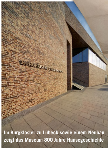
Im Burgkloster zu Lübeck sowie einem Neubau zeigt das Museum 800 Jahre Hansegeschichte

Die Besucher erfahren von Wagnis und Aufstieg, von einer Welt in Reichtum und Macht, von Misserfolg und Kampf sowie von Todesgefahren, Gottesfürchtigkeit und dem alles bestimmenden Glauben. Auch die nach dem Niedergang der Hanse einset-