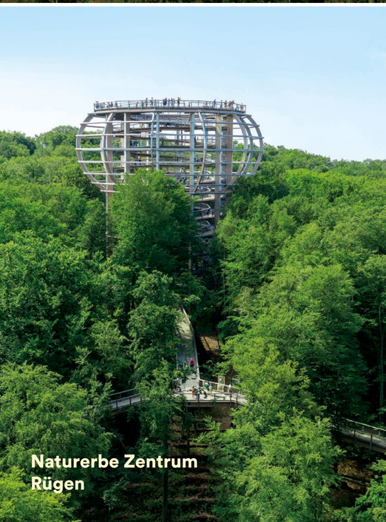
Naturerbe Zentrum Rügen

Einrichtungen der Erlebnis Akademie AG www.eak-ag.de