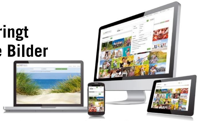
„EASYimages“ verwaltet webbasiert die Bilder eines Unternehmens

Wenn es um ihr Bildarchiv geht, haben viele Reiseveranstalter ähnliche Probleme: Sie haben unzählige Bilder aus unterschiedlichsten Quellen in verschiedenen Ordnern auf diversen Datenträgern. Dabei ist nicht nur die Suche nach den richtigen Fotos eine langwierige Angelegenheit, auch die Frage der Nutzungsrechte ist häufig schwierig zu beantworten. Der neue Online-Service „EASYimages“ der KOBEmedia GmbH bringt Ordnung in die Reisebilderarchive: Hier können Bilder einfach hochgeladen werden und mit weiteren Informatio-