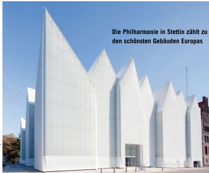
Die Philharmonie in Stettin zählt zu den schönsten Gebäuden Europas

neuen Philharmoniebau, ausgezeichnet mit dem renommierten Mies-van-der-Rohe-Preis als schönstes Gebäude Europas, ist das grenznahe Stettin um eine weitere Attraktion reicher. Da laut Travel Projekt Kurzreisen ohnehin immer beliebter werden, hält der Incomer auch neue Rei-