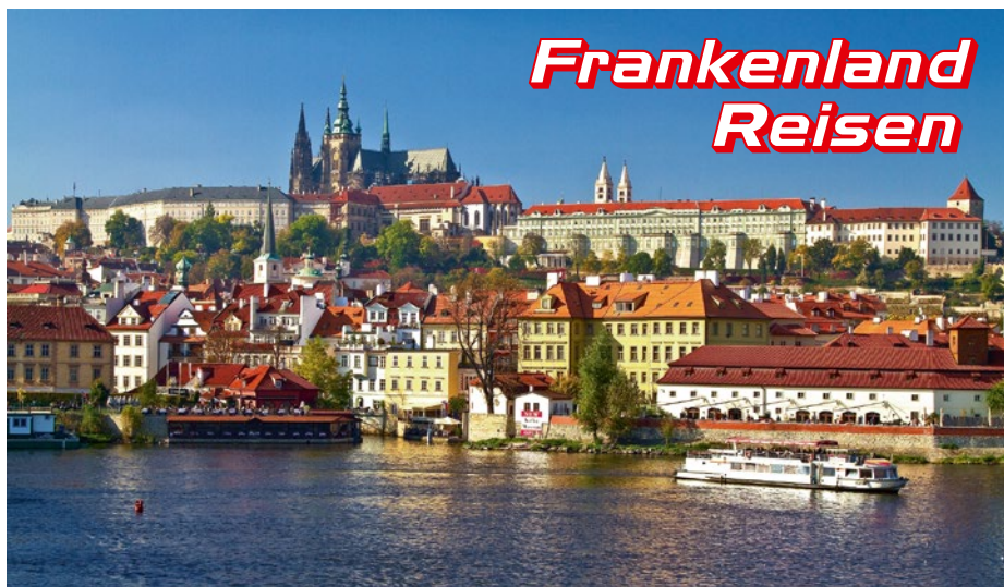
Prag gehört seit Jahren zu den beliebtesten europäischen Hauptstädten

Beim Kurpendelsystem verknüpft Frankenland Reisen inzwischen seit acht Jahren das Know-How des Paketreiseveranstalters mit dem des Busreiseveranstalters. Für Busreiseveranstalter, die das Böhmisches Bäderdreieck erstmals oder mit mehreren Terminen und verschiedenen Hotels zur Wahl anbieten wollen, besteht das Risiko, dass alle oder einzelne Termine nur schlecht gebucht werden. Absagen bedeutet Imageschaden und keine Einnahmen, deshalb