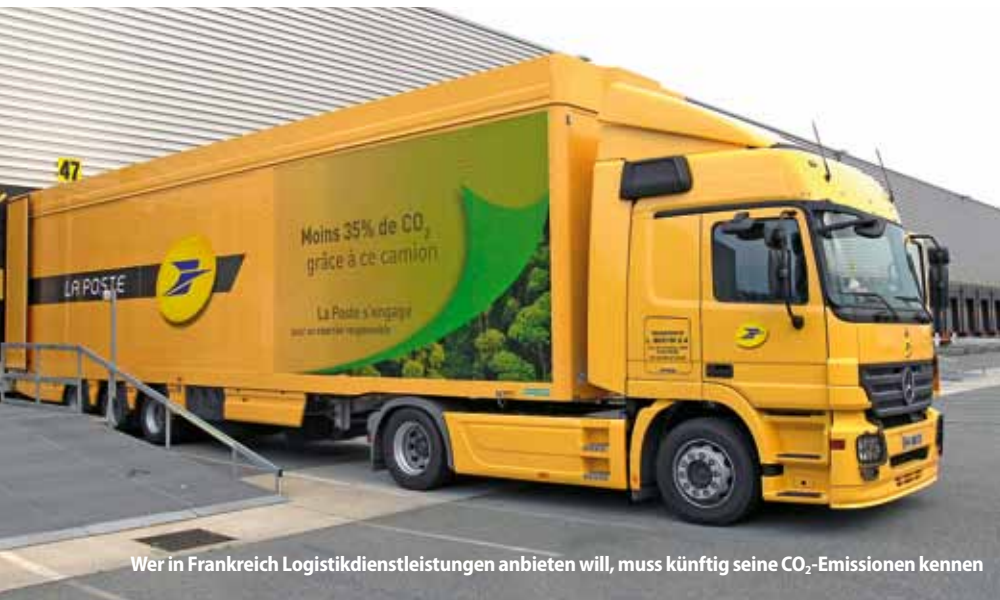
Wer in Frankreich Logistikdienstleistungen anbieten will, muss künftig seine CO 2 -Emissionen kennen