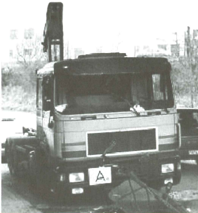
Fahrer nicht angeschnallt, herausgeschleudert, tot

Da Appelle an Vernunft und Einsicht der Verkehrsteilnehmer bislang nicht den gewünschten Erfolg erzielt haben, sind die Verwarnungsgebühren beim Verstoß gegen die Gurtpflicht in den vergangenen Jahren stark angehoben worden. Fahren ohne Gurt wird mit Bußgeld geahndet, schlimmstenfalls kostet es das Leben.