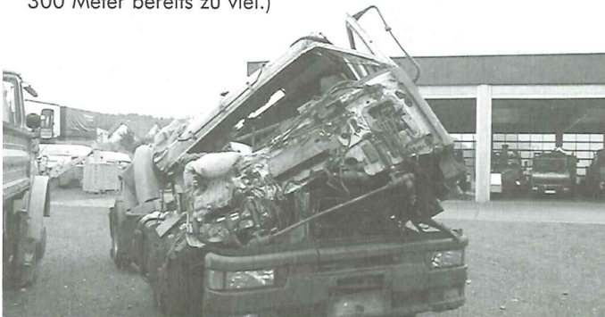
Fahrer unverletzt dank Gurt