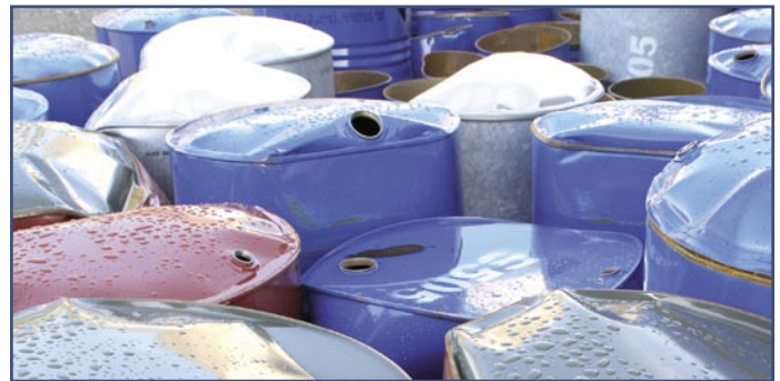
VERPACKUNG / PACKAGING