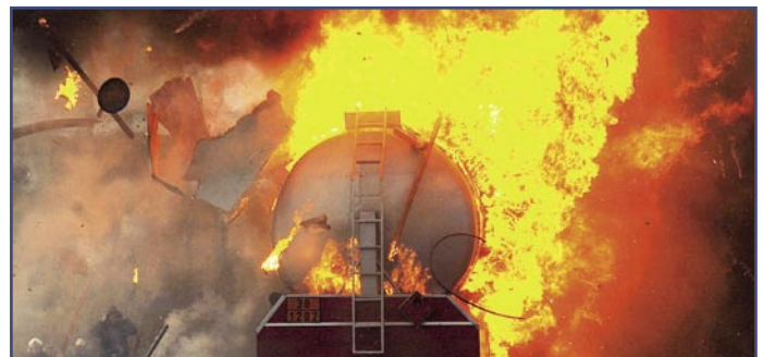
LAGER / WAREHOUSE

Please find herein a comprehensive overview under the form of a table of contact persons in admission offices in Germany and abroad.