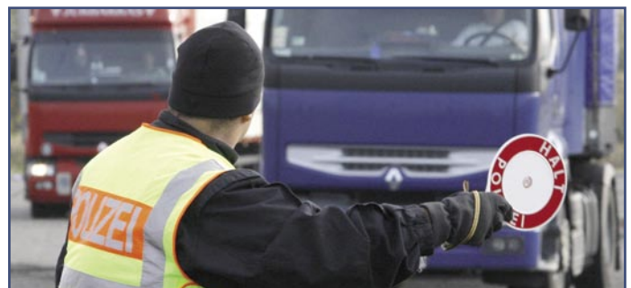
AUSBILDUNG / TRAINING

What must be observed when storing flammable liquids and what will be the changes going along with GHS.