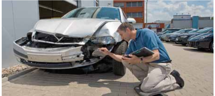
Bild links: Kleiner Dotzer auf dem Betriebsgelände? Kann bei hoher Kundenfrequenz schnell passieren. Bild oben: Mit Sicherheit ein worst case, aber nicht auszuschließen: Durch zum Beispiel eine fehlerhafte Reparatur an der Bremse kommt es bei der anschließenden Urlaubsfahrt des Kunden zu einem Unfall mit Personen- und Sachschäden.

zeug beschädigt, kann das ganz schön teuer werden. Damit ein versicherter Schaden auch vollständig ersetzt wird, sollte sich die gewählte Versicherungssumme der Zusatz-Haftpflichtversicherung am Wert der zu reparierenden Fahrzeuge orientieren.