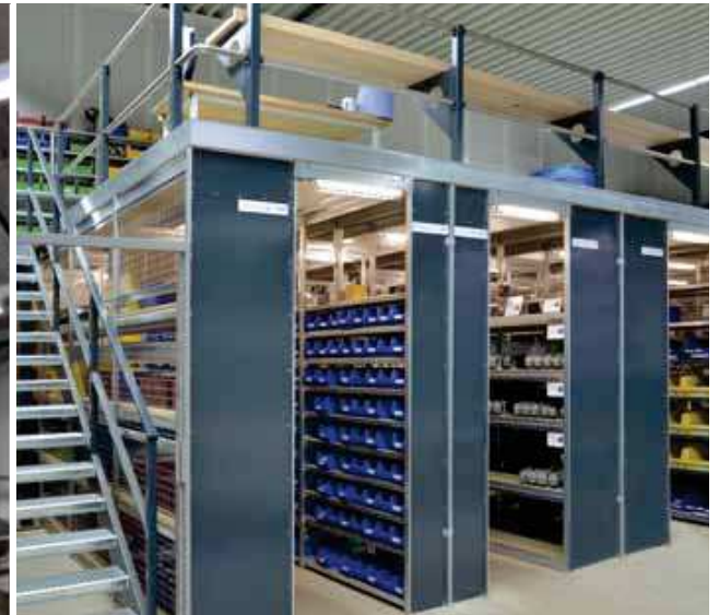
▲ ▼ Regale mit Gesamtdeckung