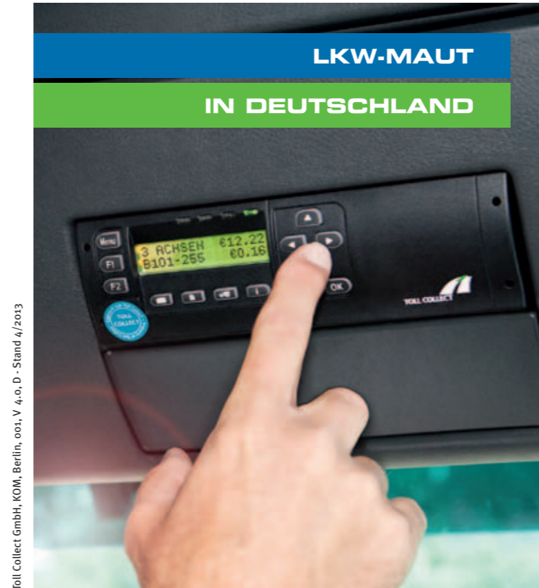
Toll Collect GmbH, KOM, Berlin, 001, V 4,0, D - Stand 4/2013