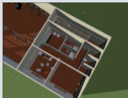
... von Hebebühnen, technischen Anschlüssen, Sozialräumen oder Büros ausprobieren und auch die Gestaltung ...