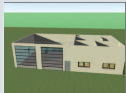
... der Außenfassade, den Einbau verschiedener Tor- und Designelemente durchspielen