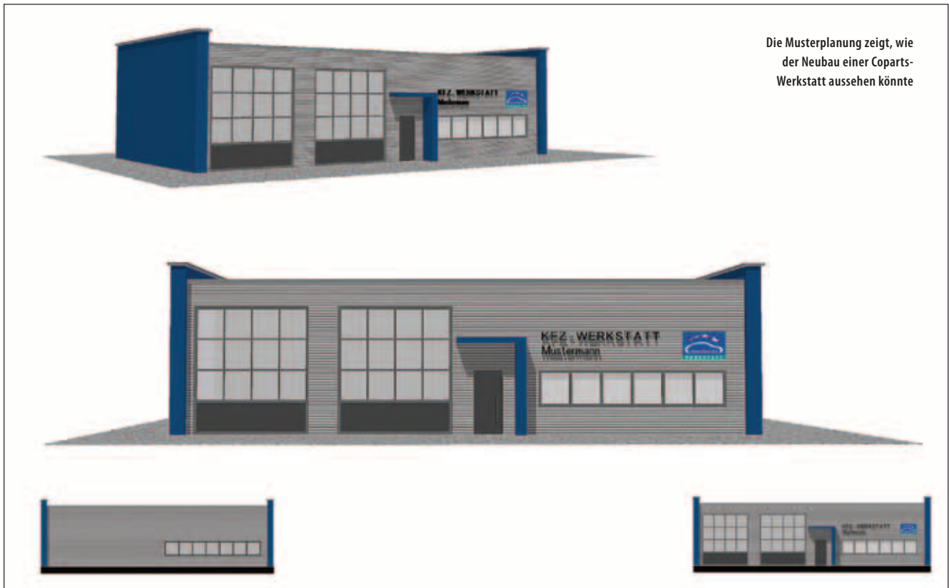
Die Musterplanung zeigt, wie der Neubau einer Coparts-Werkstatt aussehen könnte

Bild Seite 63 Schlieben, Bilder Seite 64 Coparts