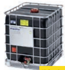
IBC mit leitfähiger Oberfläche.