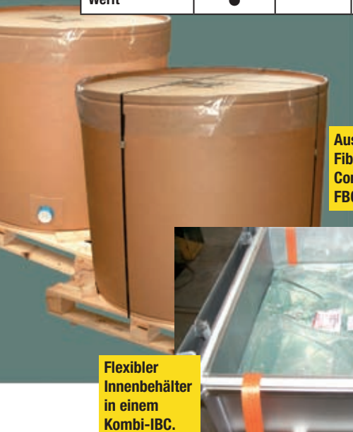
Aus Papier: Fibre Bulk Container FBC.

Für die komplette Vorschrift siehe ADR Kap. 6.5.1.4