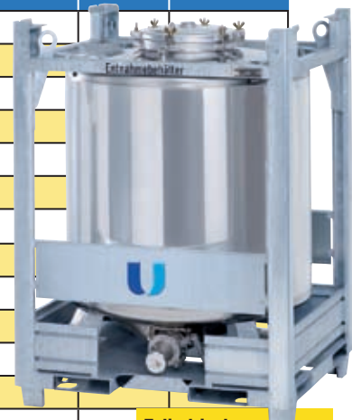
Zylindrischer Edelstahl-IBC mit angeschweißten Ösen für mehr Stabilität beim Kranhandling.