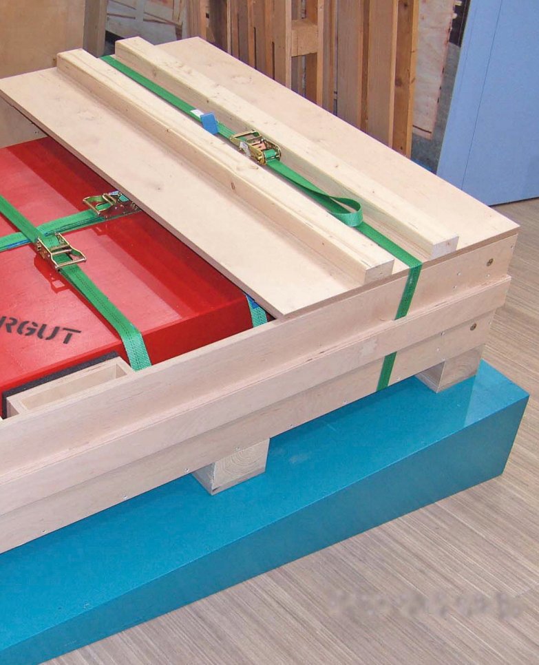
Für die Holzkiste von Huber & Sohn läuft derzeit das Verfahren zur Zulassung für defekte Lithiumbatterien bei der BAM.