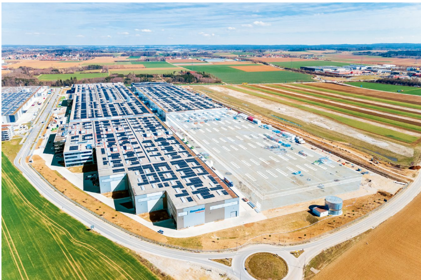
VGP Park München: Nachhaltig durch Photovoltaikanlage und Ausgleichsflächen. Individuell angepasste Lösungen für Forschung, Produktion, Logistik und Verwaltung

Vollständig automatisierte Logistiklager, hochmoderne Lösungen für Robotisierung und ein wieder zunehmender E-Commerce - die Anforderungen an Logistikimmobilien verändern sich genau so rasant wie der gesamte Logistikmarkt.