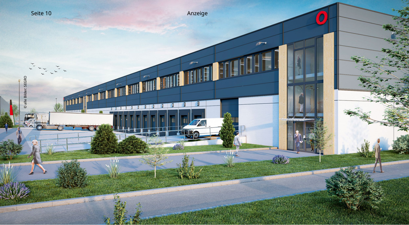
Erste Logistikkimmobilie mit Tragwerk komplett aus Holz: das spekulative SEGRO Logistics Centre Hamburg Neu Wulmstorf