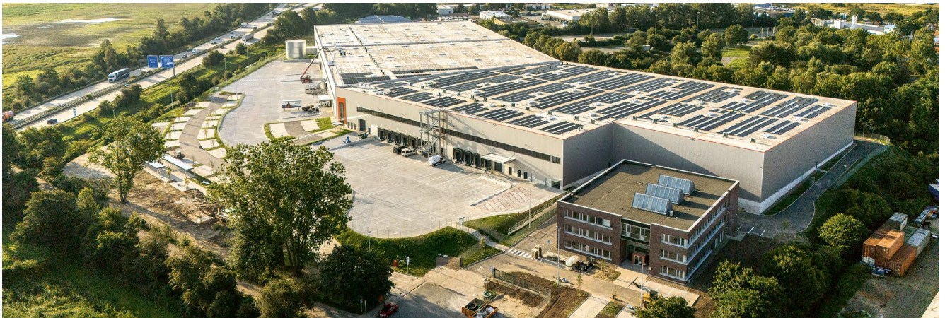
Nachhaltiger Neubau auf einer ehemaligen Mülldeponie: Der CTPark Bremen

Geht es um die nachhaltige Entwicklung von Logistikimmobilien, führt an der Revitalisierung von Brachflächen kein Weg vorbei. Auch Immobiliennutzer und Kommunen profitieren von Brownfield-Projekten. Für ihre erfolgreiche Umsetzung braucht es langjährige Erfahrung und Know-how.