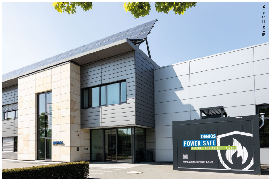
Energiespeicher direkt am Gebäude durch Brandschutz: der POWER SAFE

In der Logistik gewinnen nachhaltige Energiespeicher-Lösungen zunehmend an Bedeutung. Unternehmen müssen Energie kosteneffizient nutzen und sicher speichern.