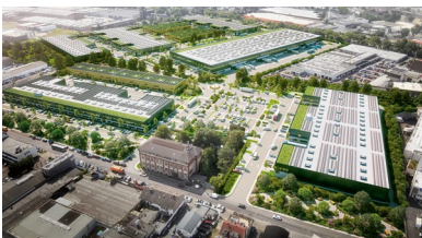
Der neue Segro-Park entsteht auf einem Brownfield (Visualisierung)

Segro hat Ende August den Spatenstich für den neuen Segro-Park Düsseldorf-Flingern auf dem Areal des ehemaligen Thyssen-Geländes zwischen Königsberger Straße und Höherweg gefeiert. In einer ersten Bauphase werden drei Objekte mit insgesamt 22.400 Quadratmeter Hallenfläche inklusive dazugehöriger Büro- und Serviceflächen entstehen. Sie sollen im ersten Quartal 2025 bezugsfähig sein. Die flexiblen Flächengrößen seien für Unternehmen aus den unterschiedlichsten Branchen und mit verschiedensten Konzepten geeignet, verspricht der Entwickler. Segro errichtet die Flächen von rund 400 bis 2000 Quadratmetern spekulativ. mh