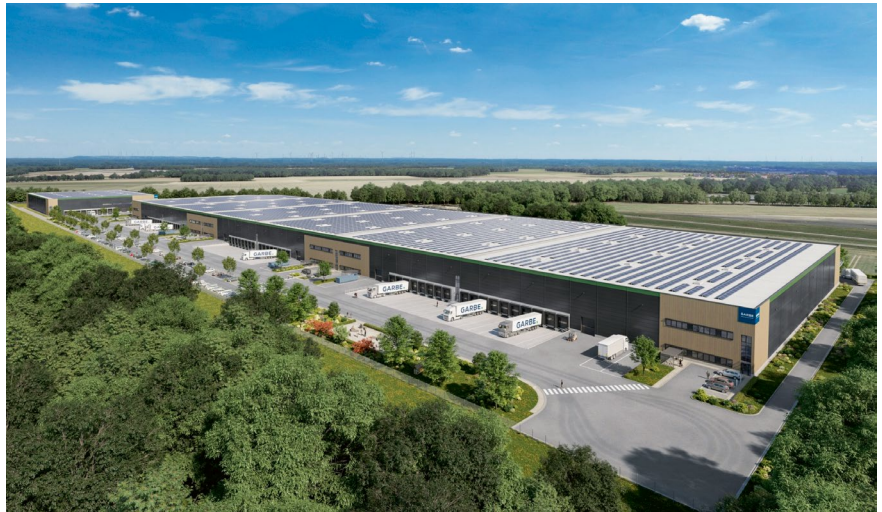
Garbe Industrial Real Estate

Auf einem Brownfield in Salzgitter entsteht bis 2026 eine neue Logistikimmobilie mit einer Fläche von 70.000 Quadratmetern.