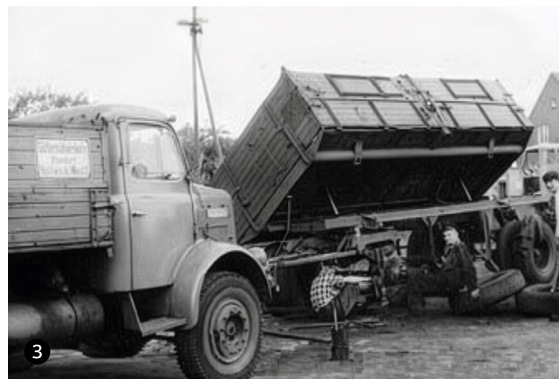
Silke Schröder (1); Spedition Prischmann (2-3)