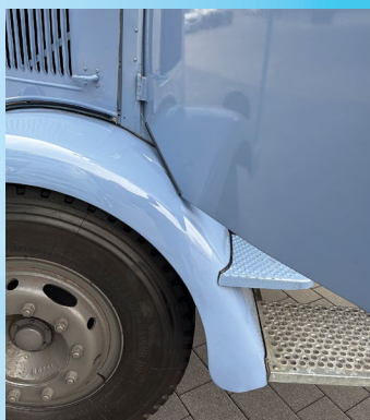
Kratzer- und Dellengefahr: Die Fahrertür stößt an den Kotflügel