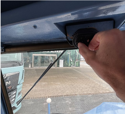
Die Scheibenwischer werden direkt an ihren E-Motoren ein- und ausgeschaltet