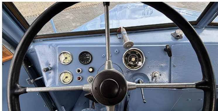
Der Begriff Servolenkung war 1946 noch nicht erfunden, die Armaturen und Schalter sind auf das Nötigste begrenzt

platzierte Elektromotor den aktuellen Löwen-Lkw nachdrücklich mit bis zu 400 Kilowatt (544 PS) und 1250 Newtonmeter Drehmoment in Richtung Zukunft. Und das abgasfrei sowie nahezu lautlos.