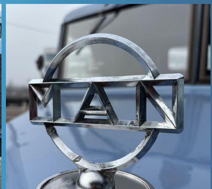
Der MK trägt das Markenemblem stolz auf der Motorhaube