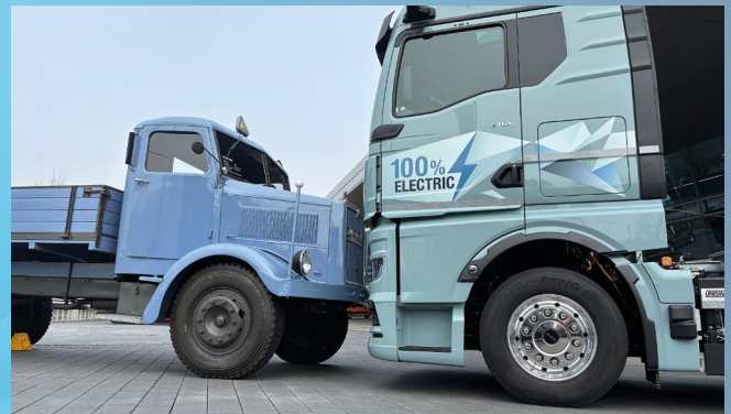
Zwischen den beiden MAN liegen 80 Jahre Lkw-Entwicklung