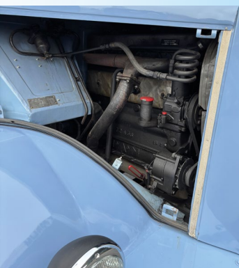
Der 7,6 Liter große Reihen-Dieselmotor leistet 120 PS