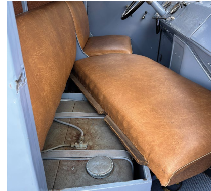
Seinen Dieselvorrat führt der MK unter der Beifahrersitzbank mit

aus zeitgenössischem Bakelit erhalten. Endlich auf dem Fahrersitz Platz genommen, geht es mit der Enge allerdings erst richtig los, denn das Volant baut sich gefühlt direkt vor der Brust auf und ist zudem eigenartig zur rechten Seite hin versetzt. Entweder ist der Sitz zu weit links oder das Lenkrad zu weit rechts ... Wie auch immer, man nimmt gezwungenermaßen eine leicht schiefe Sitzposition ein – Ergonomie war Mitte der 40er-Jahre eben noch ein Fremdwort. Ebenso der Begriff Servolenkung, weshalb das „Steuerrad“ entsprechend groß ausfallen muss. Erst jetzt registrieren wir den Oldtimer-typischen Geruch nach Schmierfett und Öl, dass jedes alte Fahrzeug, egal ob Motorrad, Auto, Lkw oder Schiff, umgibt.