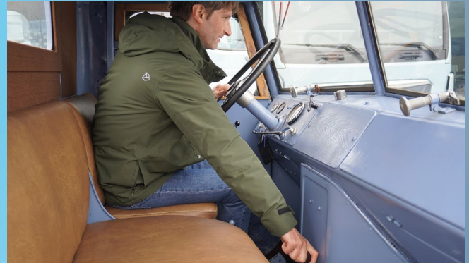
Der Schalthebel ist ergonomisch wenig günstig platziert