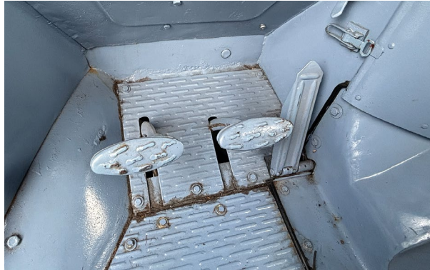
Die stehende Pedalerie verlangt nach einem kräftigen Tritt und wirkt für die Ewigkeit konstruiert