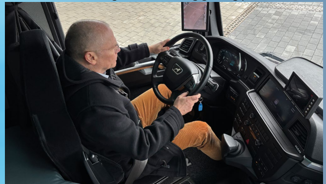
Beste Ergonomie und Komfort pur im aktuellen MAN eTGX