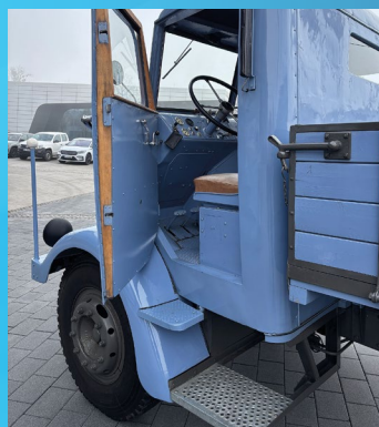
Zwei Trittstufen helfen beim Einsteigen, Haltegriffe gibt es keine