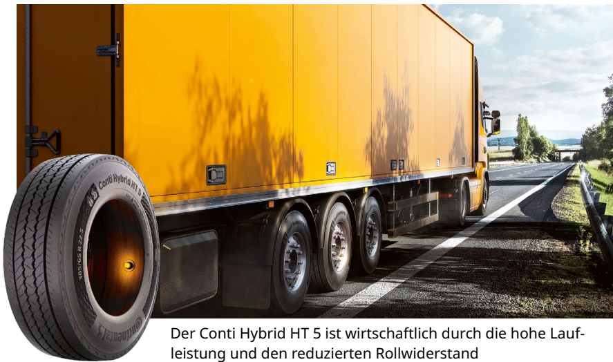
Der Conti Hybrid HT 5 ist wirtschaftlich durch die hohe Laufleistung und den reduzierten Rollwiderstand

Der neue Trailerreifen Conti Hybrid HT 5 überzeugt mit höherer Laufleistung, spürbaren Einsparpotenzialen und verbesserter Nass- und Winterhaftung.